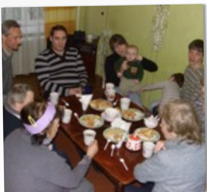
ПЕРВАЯ ДОМАШНЯЯ ГРУППА

В настоящее время ведется подготовка к празднованию Пасхи и дня рождения церкви, ведется миссионерская работа в Дрогобыче, куда в мае планируется переезд семьи одного из служителей.