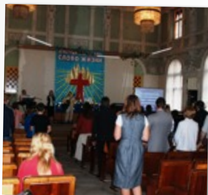
СЛУЖЕНИЕ В ЦЕРКВИ